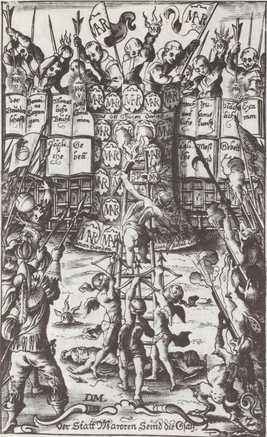
Der Staff Maroren Seind die Glatz.