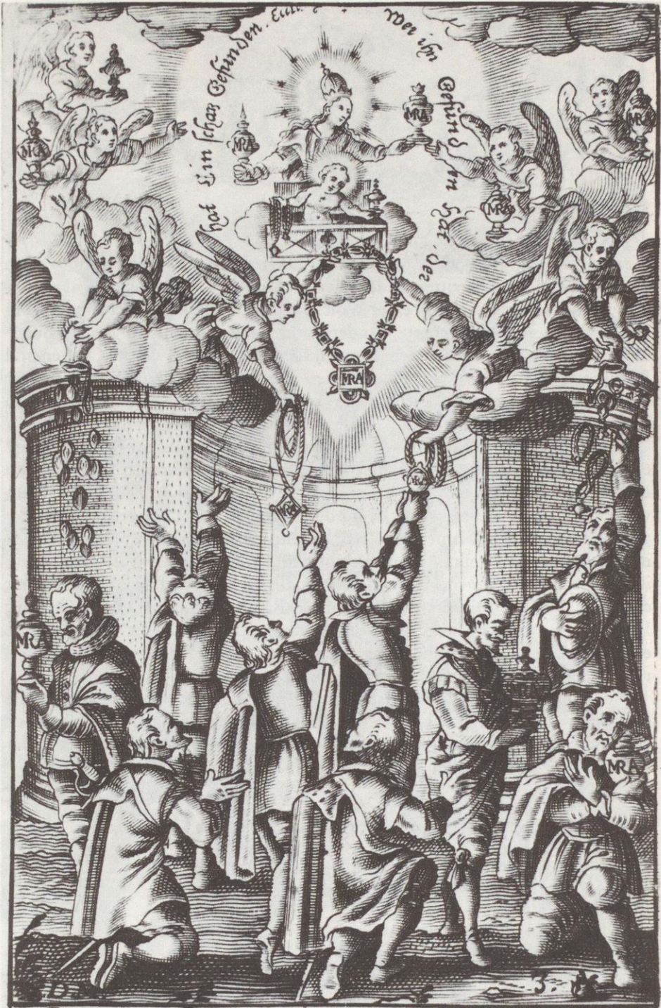
Domus Aurea. Du Guldens Haüß.