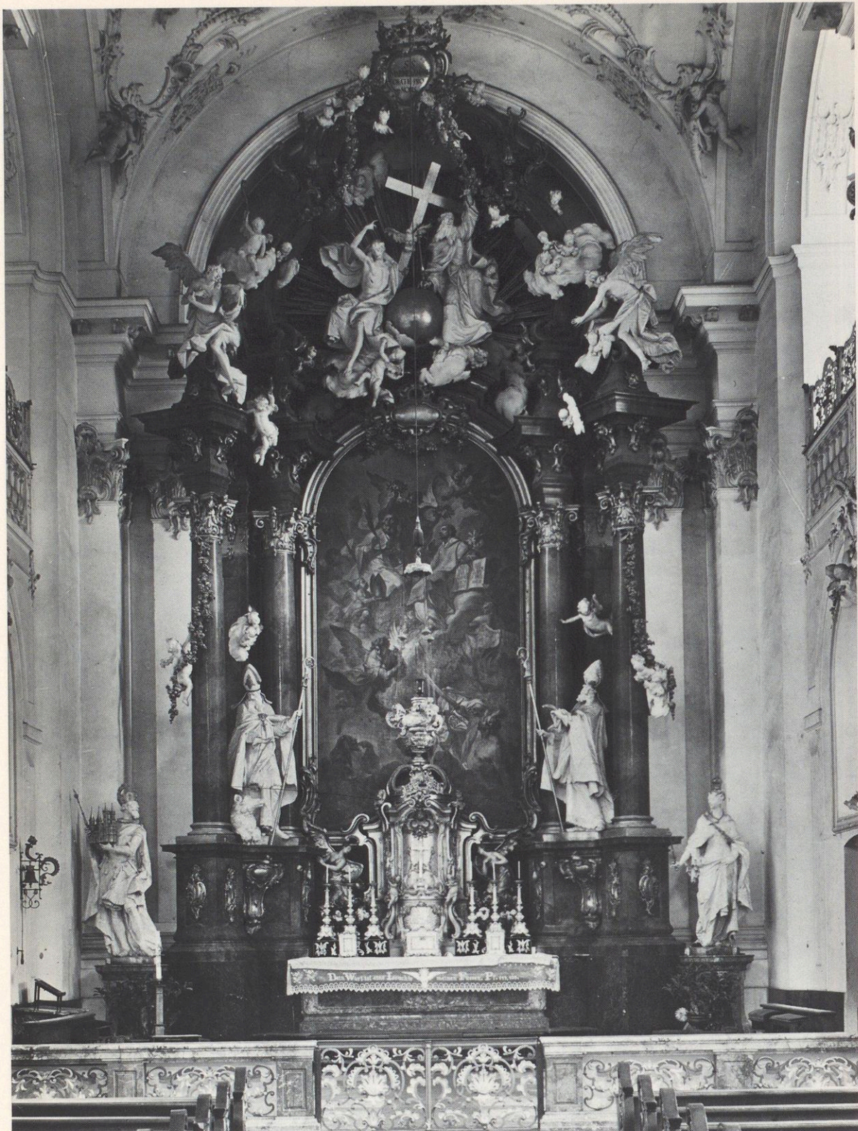
50/51 Rott am Inn, Benediktinerabtei-, jetzt Pfarrkirche: Hochaltar von Ignaz Günther 1760/61: St. Ulrich mit St. Korbinian – Mühlendorf bei Hohenkammer, Wallfahrtskirche St. Ulrich. Hochaltar von Konstantin Pader, 1658/59: St. Ulrich