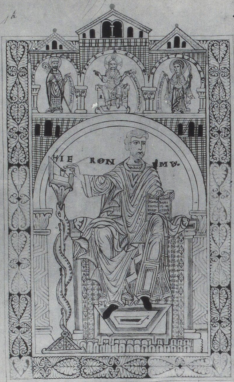
65 Augsburg, Staats- und Stadtbibliothek, 2 o Cod. 36 fol. 1 v : Der hl. Hieronymus, darüber thronender Christus zwischen den Heiligen Ulrich und Afra