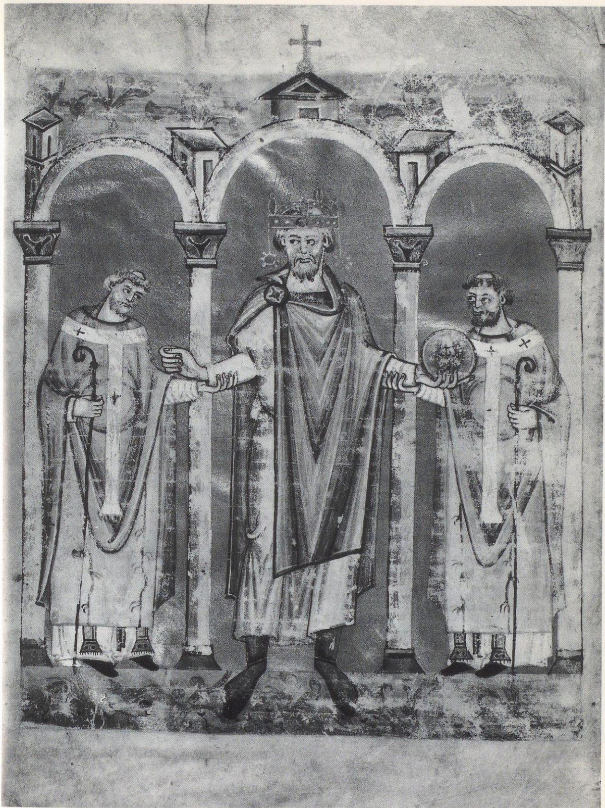
60 Bamberg, Staatsbibliothek, Msc.Lit. 53 fol. 2 v : Heinrich II. wird von zwei Bischöfen geleitet