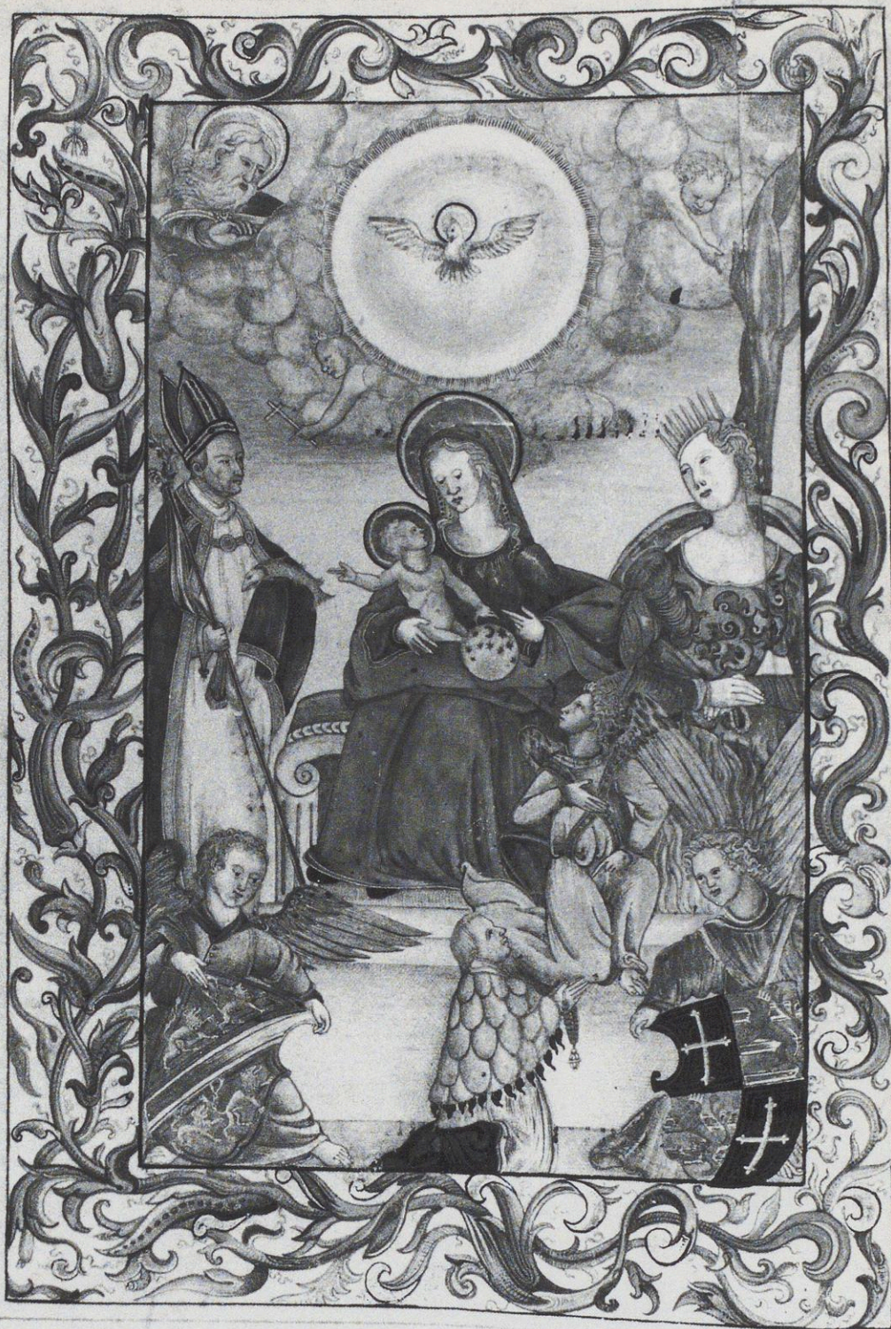
84 Augsburg, Bistumsarchiv, Hs. 24a, vor fol. 1: Titelminiatur des Evangelistars aus dem Augsburger Dom