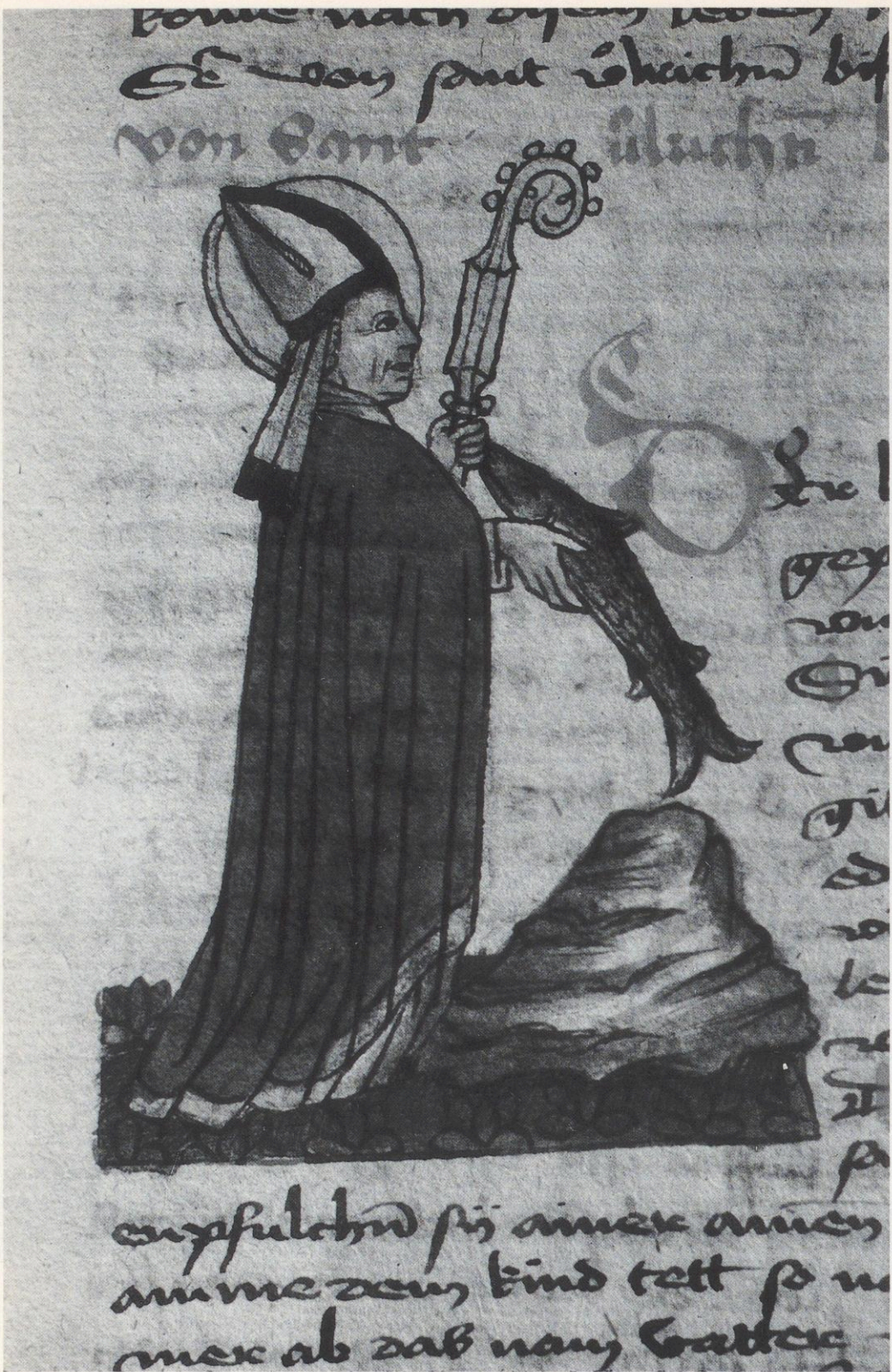
79 Sigmaringen, Fürstlich Hohenzollernsche Hofbibliothek, Hs. 24 fol. 90r: Der hl. Ulrich