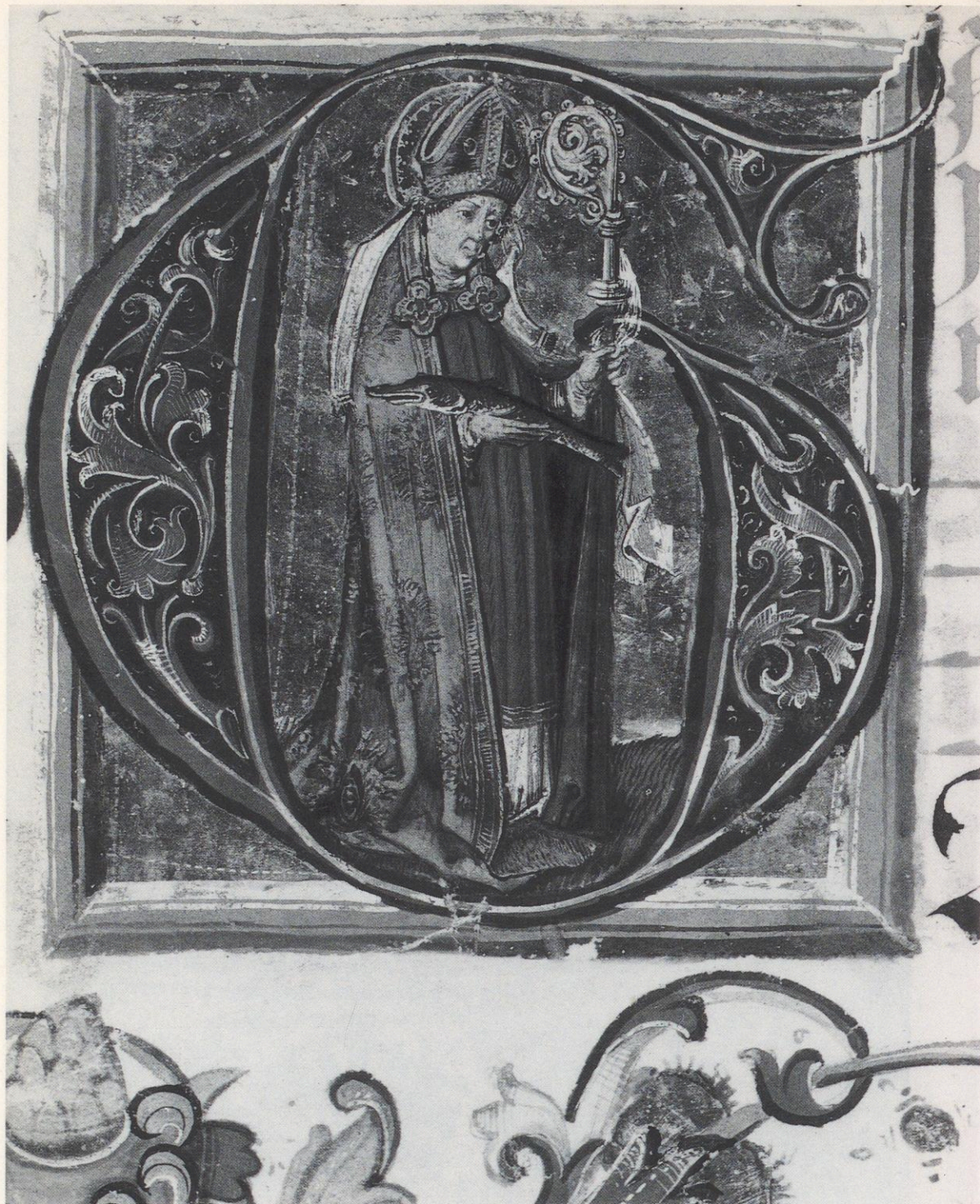
77 Augsburg, Staats- und Stadtbibliothek, 2° Cod. 49a fol. 179°: G-Initiale mit dem hl. Ulrich