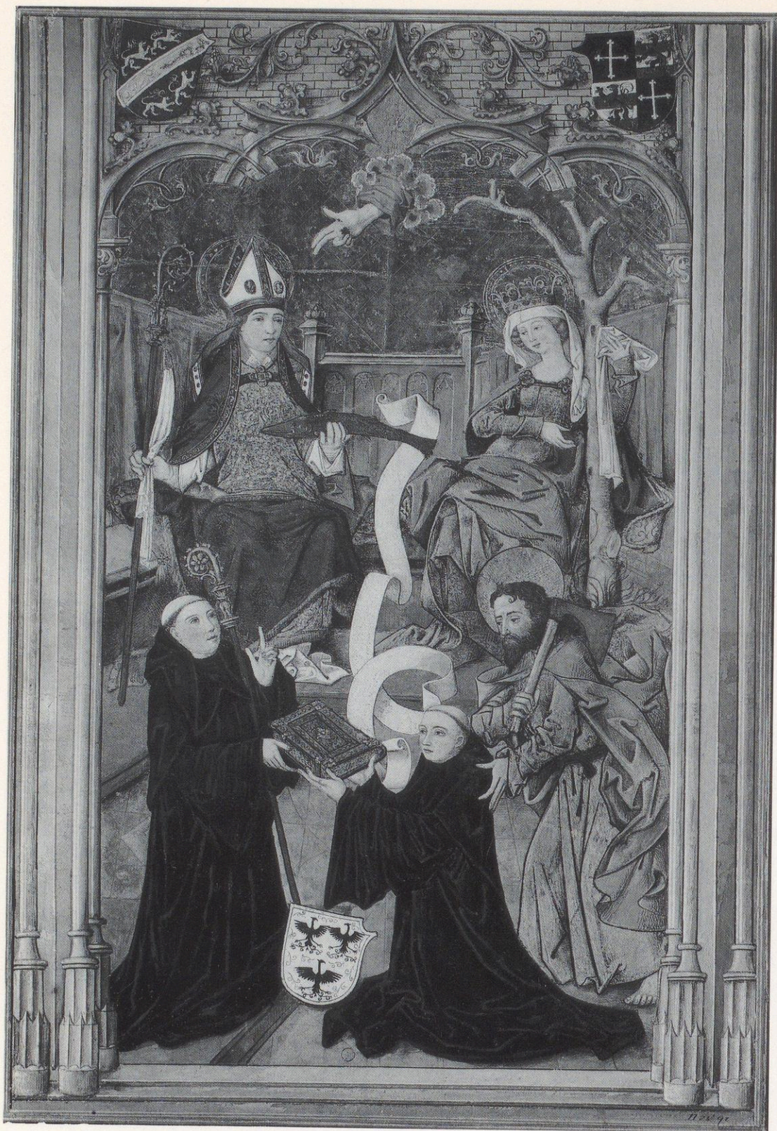
83 London, Victoria & Albert Museum, D. 86-1892 Ms. 425: Dedikationsbild zu dem Psalterium Augsburg, Staats- und Stadtbibliothek, 2° Cod. 49a