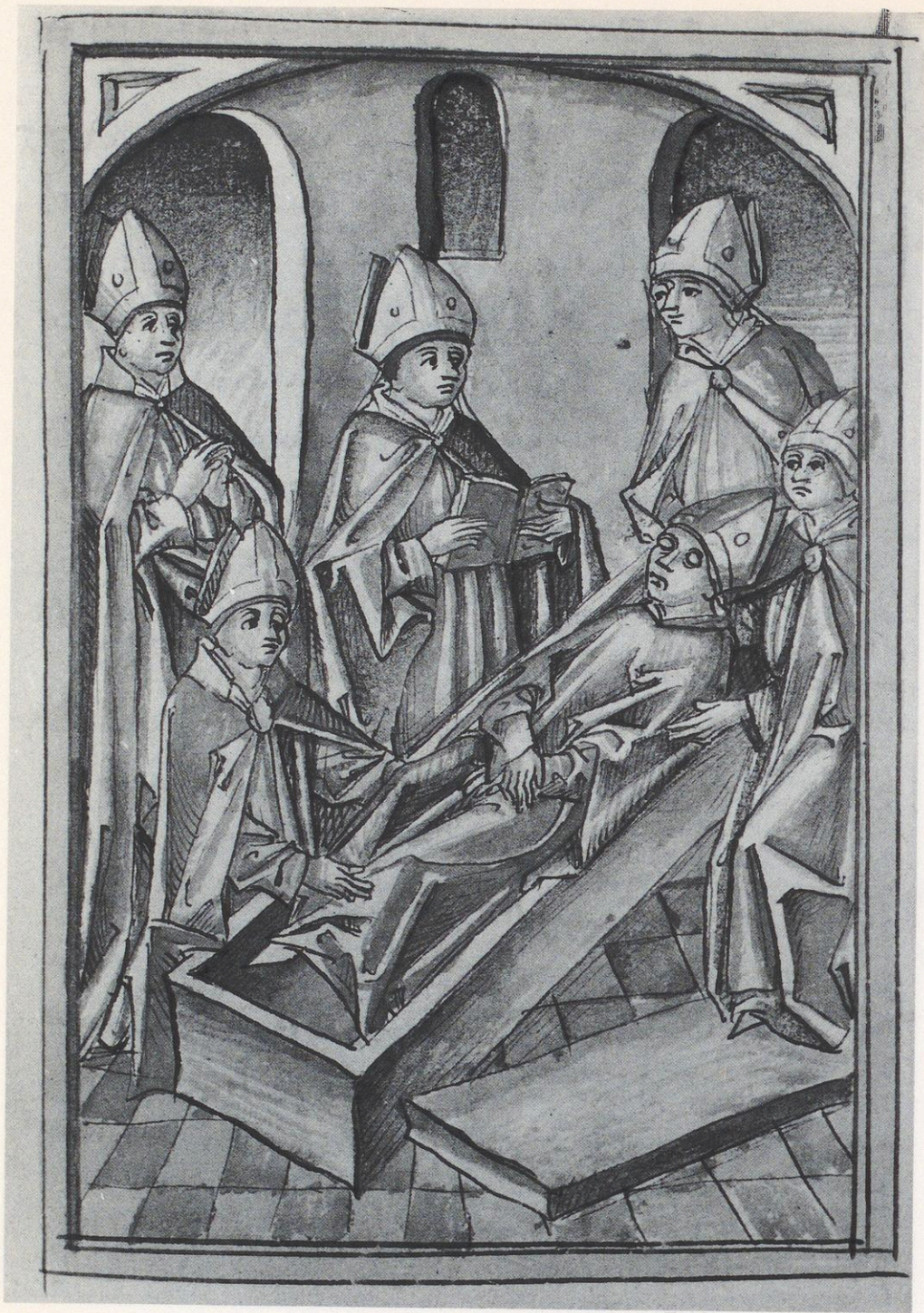
99 Augsburg, Staats- und Stadtbibliothek, 4° Cod. Aug. 1 fol. 250r: Erhebung des hl. Ulrich