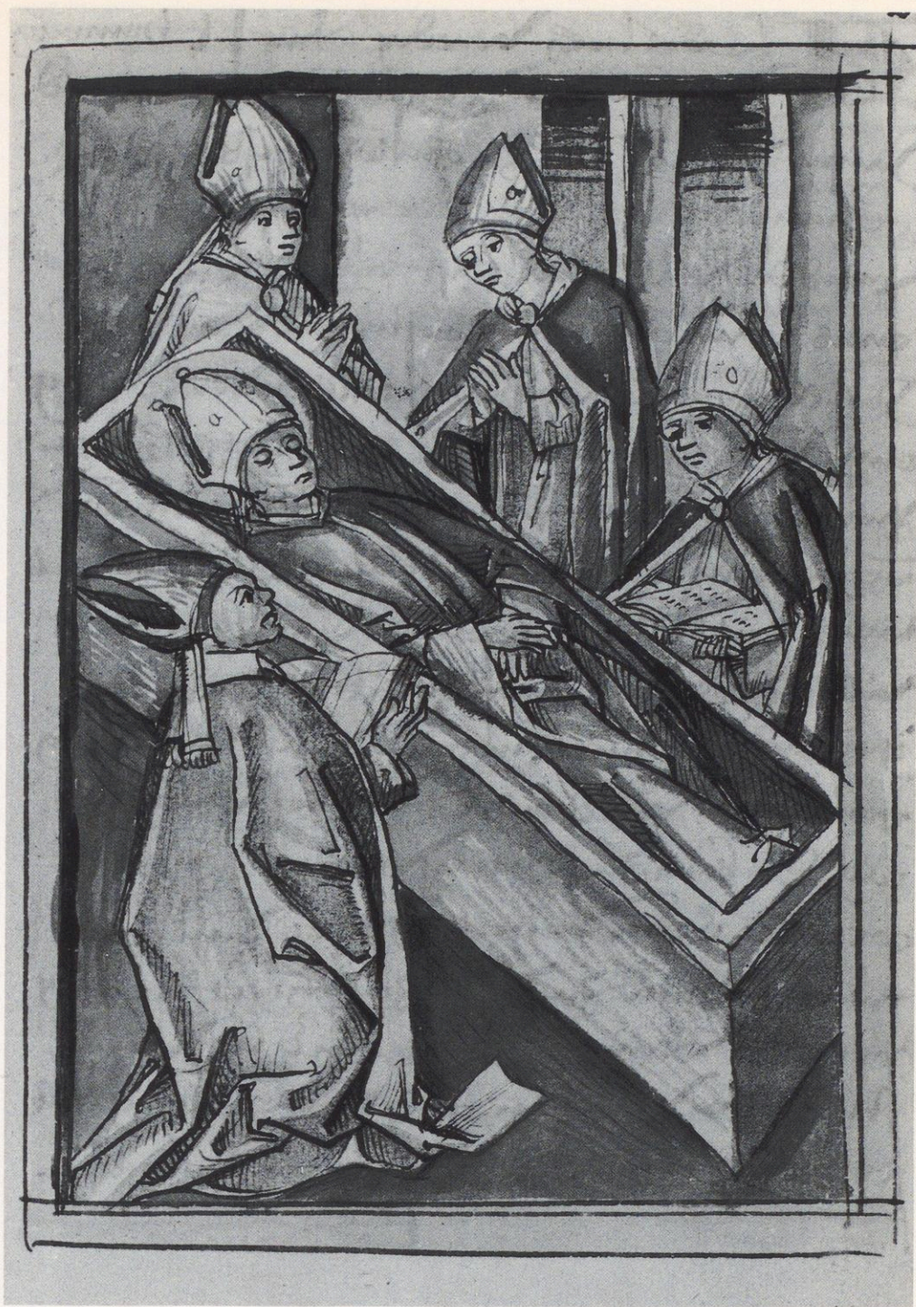
98 Augsburg, Staats- und Stadtbibliothek, 4° Cod. Aug. 1 fol. 213': Begräbnis des hl. Ulrich