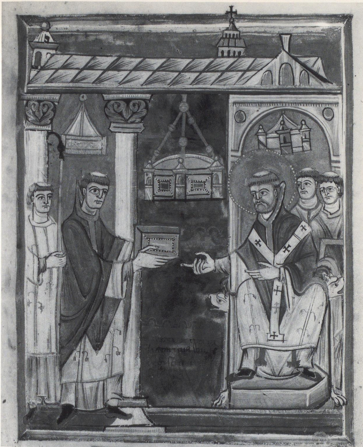
62 London, British Library, Harley ms. 2908 fol. 8 r : Dedikation des Sakramentars an einen heiligen Bischof, wahrscheinlich an den hl. Ulrich