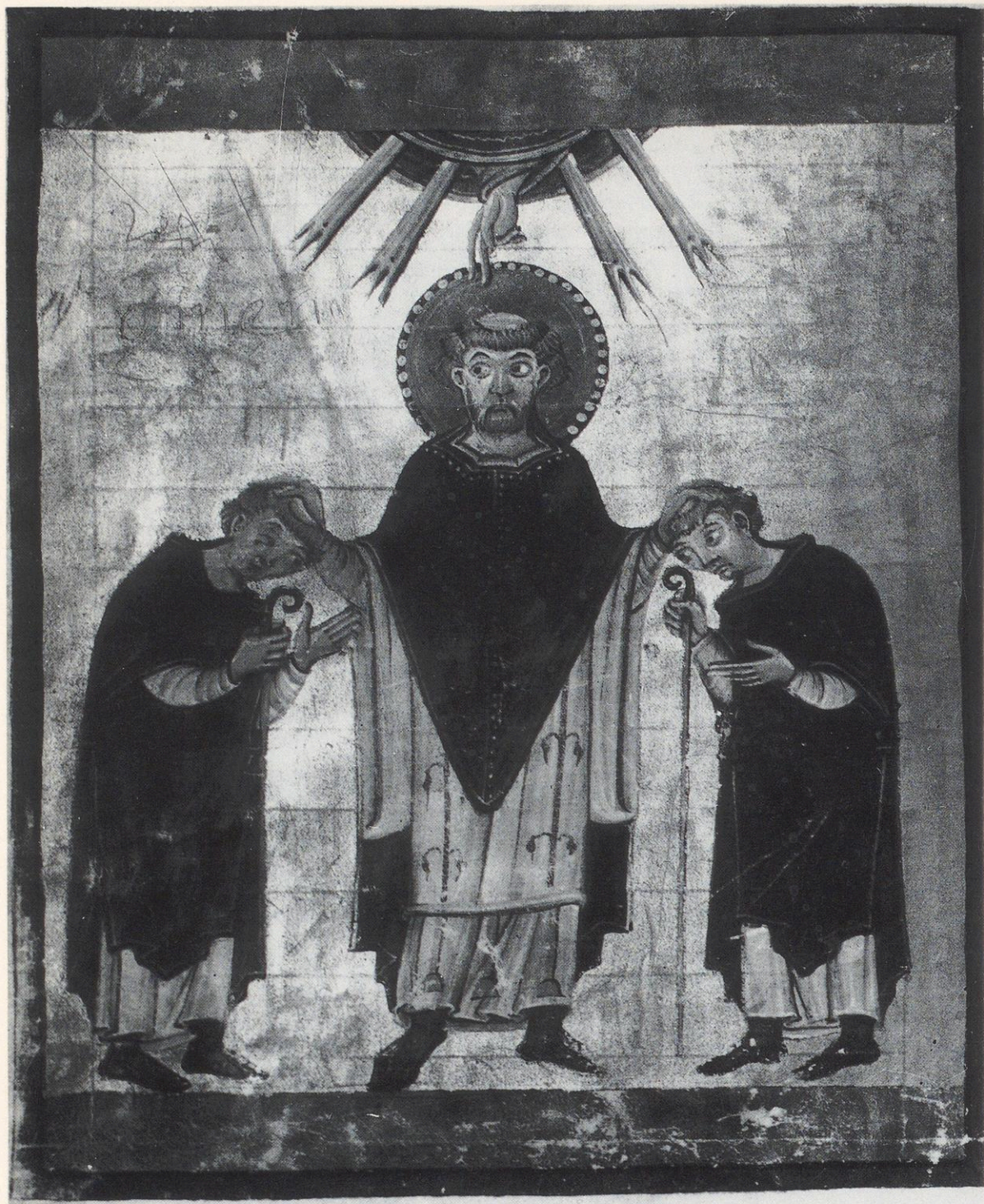
61 Wien, Österreichische Nationalbibliothek, Cod. 573 fol. 26 v : Der hl. Ulrich segnet die Äbte Berno von der Reichenau und Fridebold von St. Ulrich und Afra