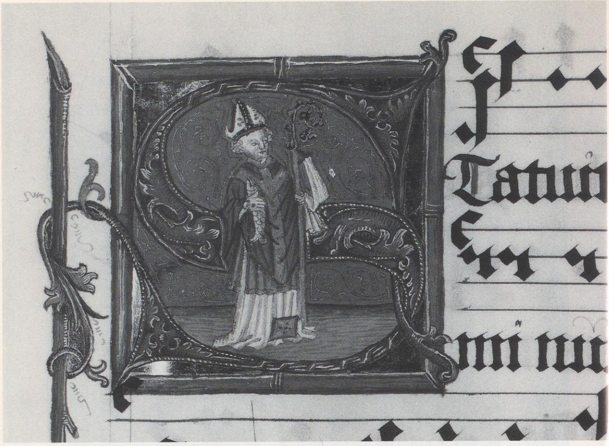
71 Wolfenbüttel, Herzog August Bibliothek, Cod. 1.5.1 Aug. 2° fol. 1r: S-Initiale mit dem hl. Ulrich