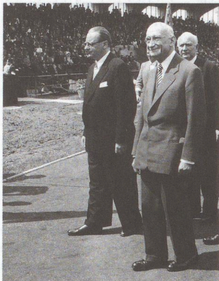
Abb. 8: Minister H. v. Brentano und R. Schuman.