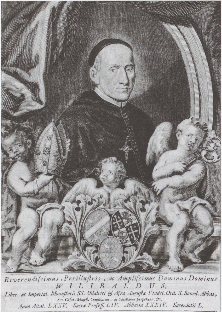
Abb. 19: Abt Willibald Popp (1694–1735) von St. Ulrich und Afra im Jahre 1728.