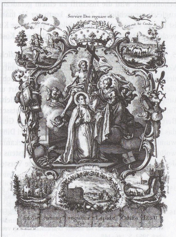
Abb. 75: Kupferstich aus dem Verlag Gebrüder Klauber, Augsburg. Stellt die Verbindung der Wies- wallfahrt mit dem Orden des hl. Norbert (Steingaden!) dar.