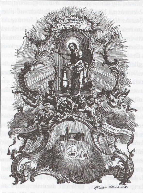
Abb. 74: Kupferstich aus dem Verlag Gebrüder Klauber, Augsburg, um 1755. Stellt die weitverbreitete Verehrung des Wiesheilands und den Segen der Wieswallfahrt dar.

Schließlich noch eine Probe aus dem letzten Abschnitt, eine Art Zusammenfassung der umfänglichen Predigt: