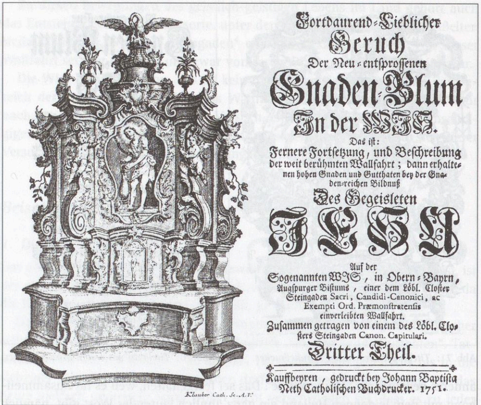
Abb. 72: Titelkupper und Titelblatt des Mirakelbuches. Dritter Teil.

den 8 , durchgehalten. So nennt der Verfasser in der ersten Sammlung (1746) Gnadenbild und Wallfahrt „Neu-entsprossene Gnaden-Blum Auf der WIS“, in der zweiten spricht der Titel von „Fernerer und noch weit mehrer sich ausbreitender Geruch Der Neu-entsprossenen Gnaden-Blum In der WIS“ (1748), und die Überschrift des dritten Teiles (1751) heißt „Fortdaurend-Lieblicher Geruch Der Neu-entsprossenen Gnaden Blum In der WIS“.