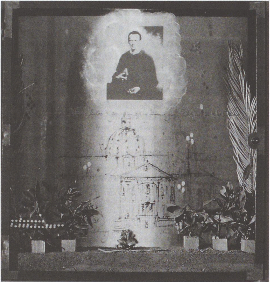
Abb. 7: Seelos-Gedenkstätte in St. Mang, Füssen.

„Befreie J. von seiner Alkoholsucht und laß uns wieder glücklich werden.“