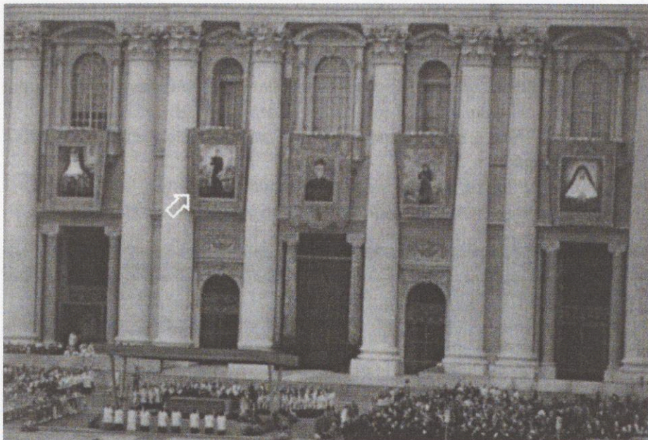
Abb. 6: Seligsprechungsfeier auf dem Petersplatz in Rom am 9. April 2000.